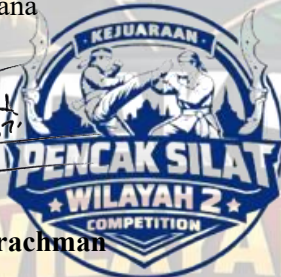
Faisal Moch Safari

Contact Person : 0857 2086 6950 - (Faisal) 0855 8936 221 - (Dapa)